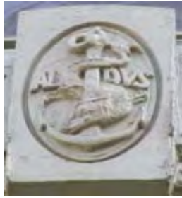
Herover: Aldus Manutius' mærke som vægskulptur (20 Vesey St, New York) Th: Fra Francesco Colonnas Hypnerotomachia Poliphili , trykt af Aldus Manutius 1499